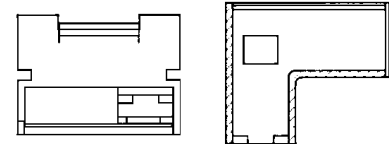
Fig.3 / 90°